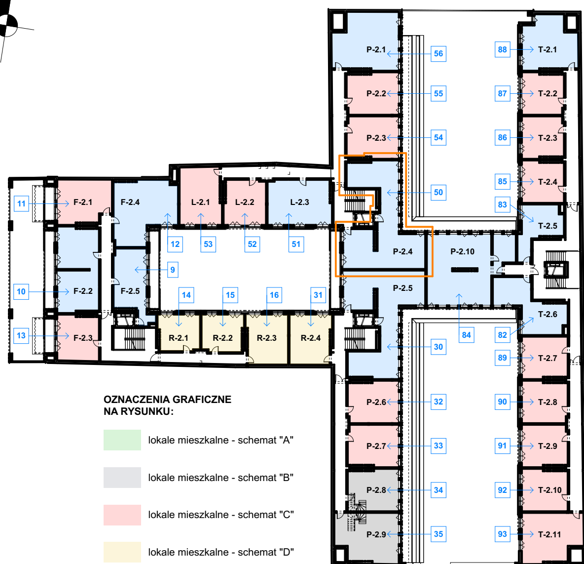
RZUT LOKALU skala 1:50