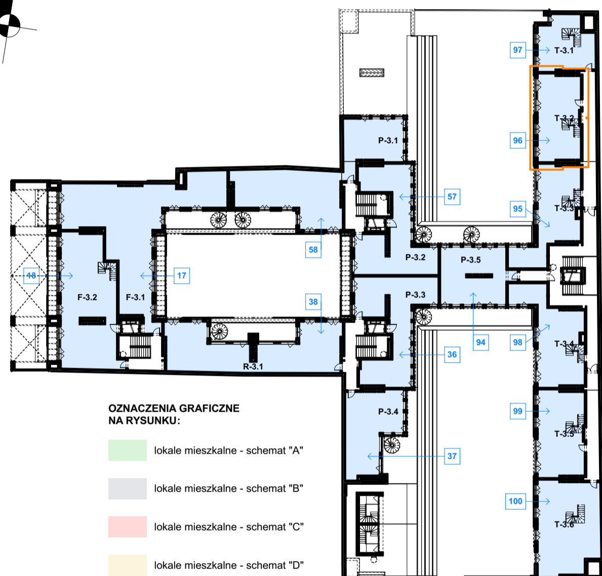
RZUT LOKALU skala 1:50