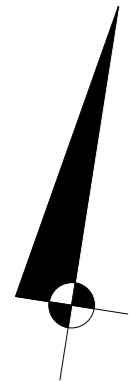
LOKALIZACJA LOKALU NA RZUCIE I PIĘTRA skala 1:500

tel.: 535 344 000 e-mail: biuro@homerevyou.pl