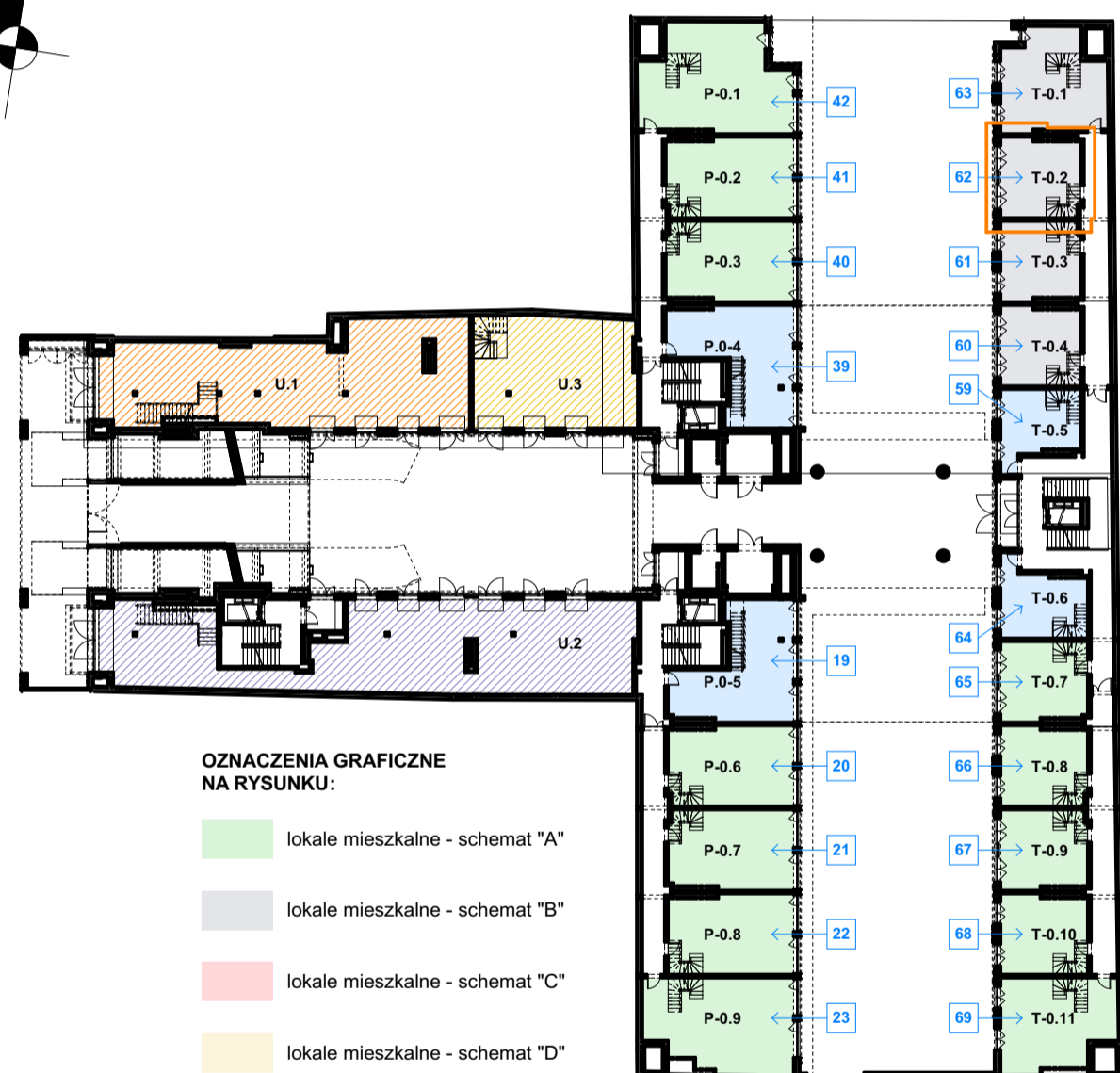
LOKALIZACJA LOKALU NA RZUCIE PARTERU skala 1:500